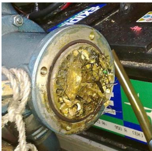
Masser af kalk udfældet.