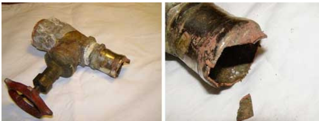
Bronzeventil med messingstuds (må man aldrig blande metaller). Studsen tærer væk!

Jeg har skiftet samtlige ventiler i min 30 år gamle Nauticat, og de var alle af bronze, og det viste sig hver gang at de faktisk ikke trængte til udskiftning, idet de ikke var tæret. Men, et sted havde værftet begået en fejl, og det var ventilen til køling af motoren. Her var der sat en 1 1/2" ventil i, altså et stort "hul". Der var monteret en studs i ventilen, MEN, denne studs var af messing !