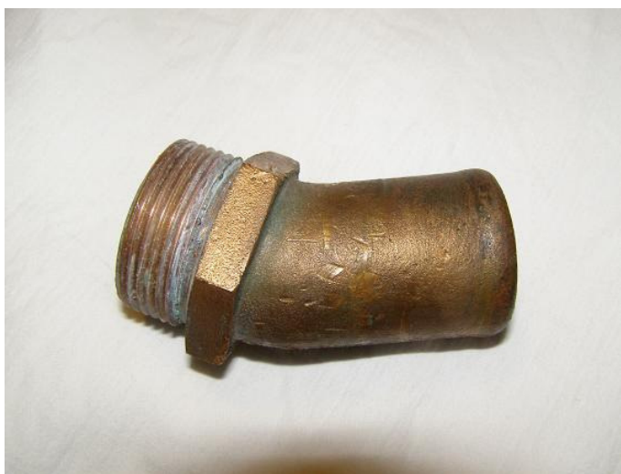
Bronzestuds, 30 år gammel, afrenset - fejler intet.

Heldigvis opdagede jeg det ved skift af ventilerne.